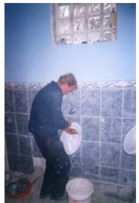
Chantier d'utilité sociale