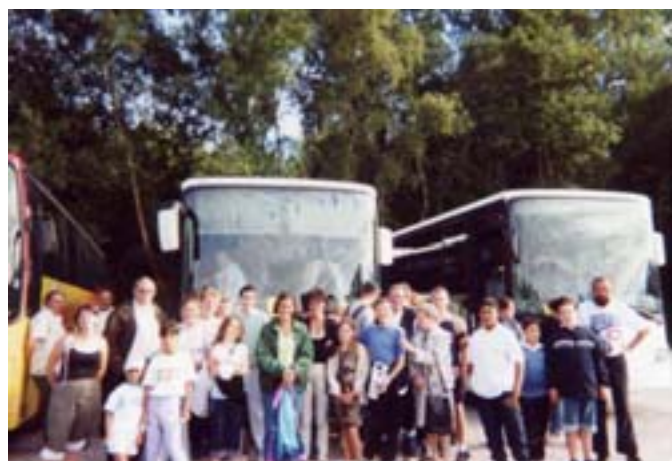
Les sorties familiales