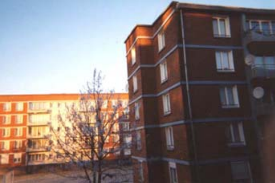
Une vue de la «Cité des Aviateurs»

En participant aux réunions du «Contrat de Ville», je me suis fait le plan décrit en première page et que j'ai appelé «Pour que tout le monde prenne le train», citation de Madame Aubry.